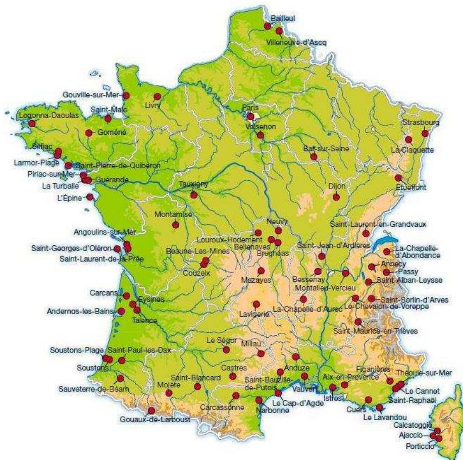
Carte des séjours adultes pour l'été 2010

ACTIVITES POSSIBLES : Visites des forêts et des plages landaises, ferias, voile, ping-pong